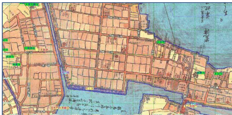
大手門・港町付近 (江戸期)

古地図・現代地図を片手にガイドと一緒に城下町の変貌を巡るまち歩き。 平成 24 年 11 月・12 月に実施したコースに続き、今回は 3 コースを歩きます。